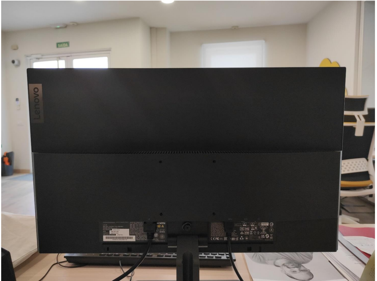
MONITOR LENOVO 27" POSTO DE REPRESENTACION E INVESTIGACIÓN