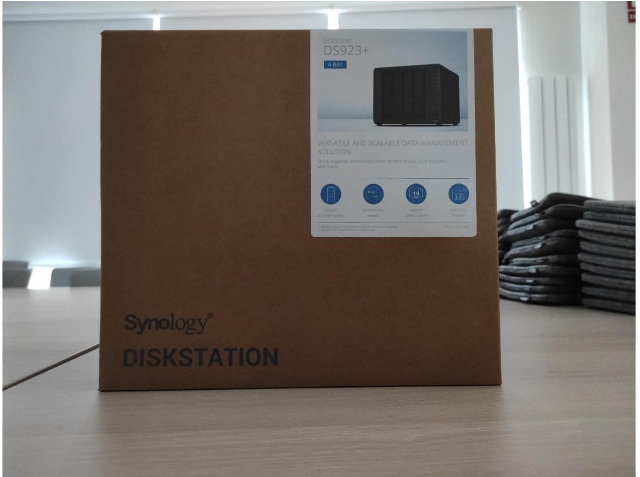
NAS SYNOLOGY MODELO DS923+