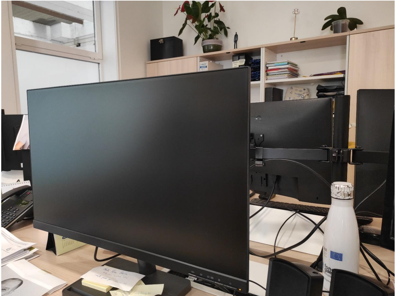
MONITOR LENOVO 27" POSTO DE REPRESENTACION E INVESTIGACIÓN