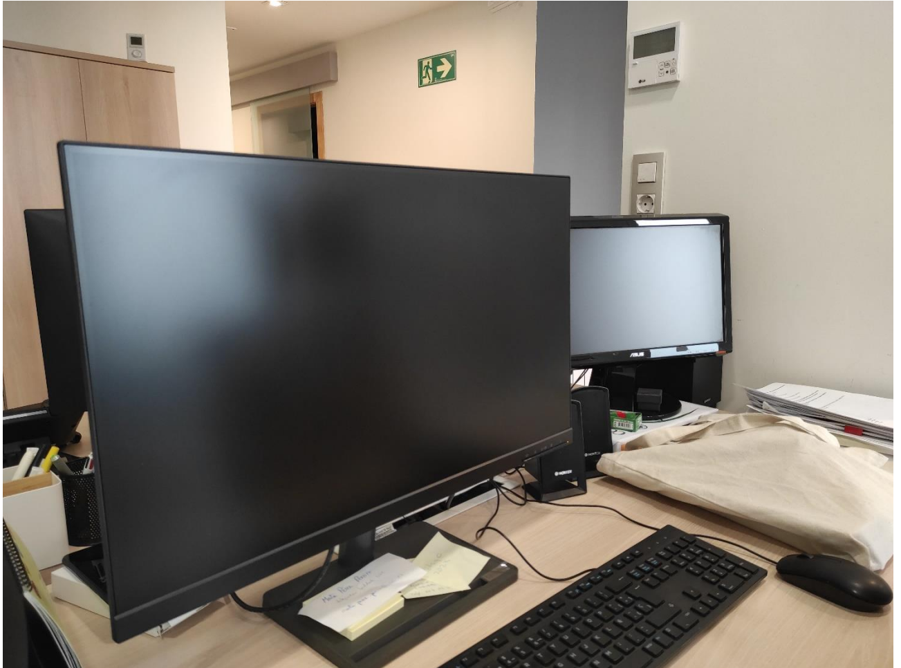
MONITOR LENOVO 27" POSTO DE REPRESENTACION E INVESTIGACIÓN