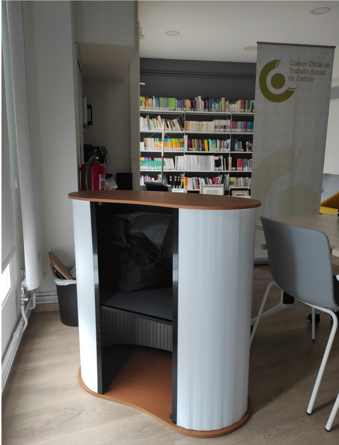
SOPORTE PARA MESA MOSTRADOR STAND PLEGABLE E TRANSPORTABLE