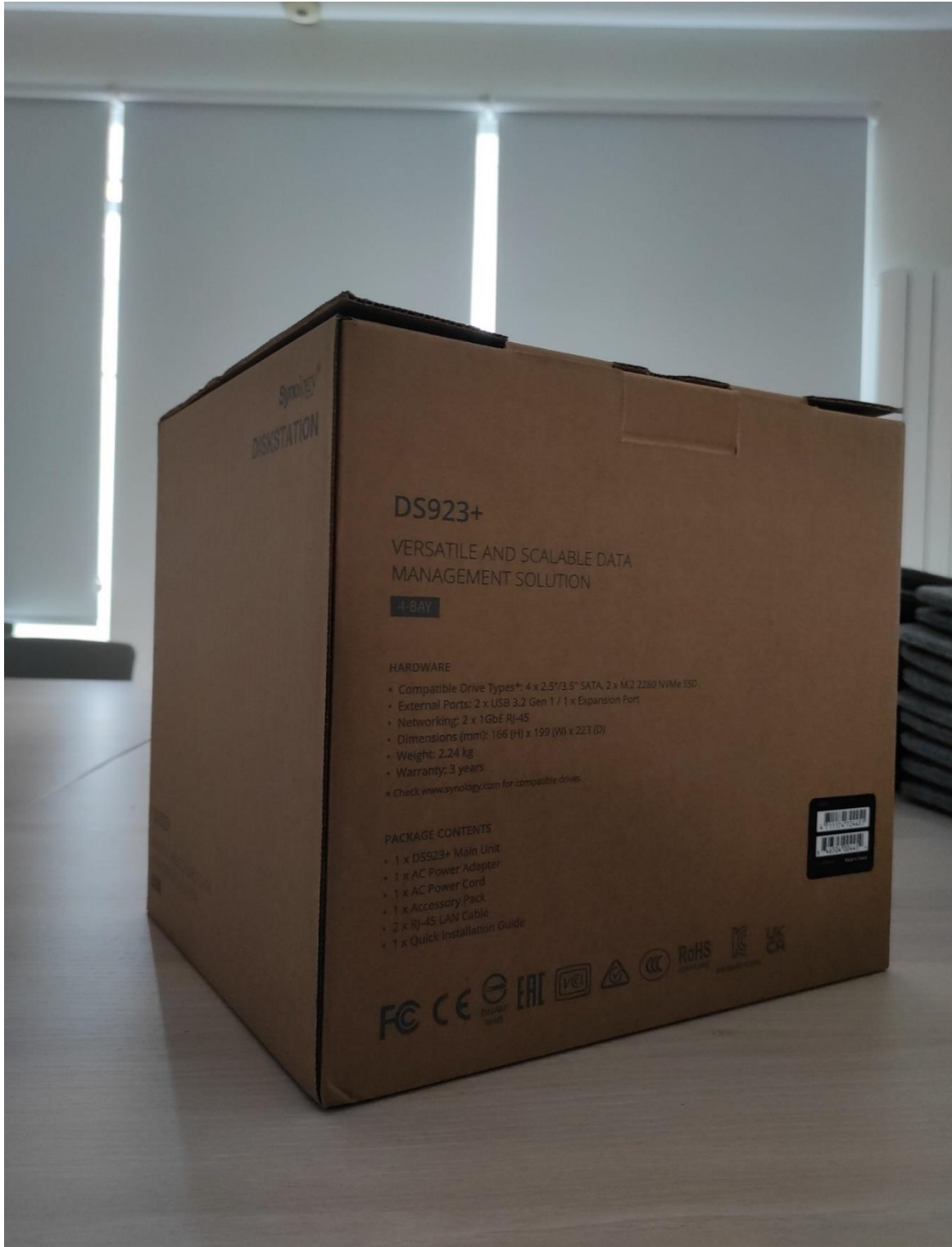
NAS SYNOLOGY MODELO DS923+