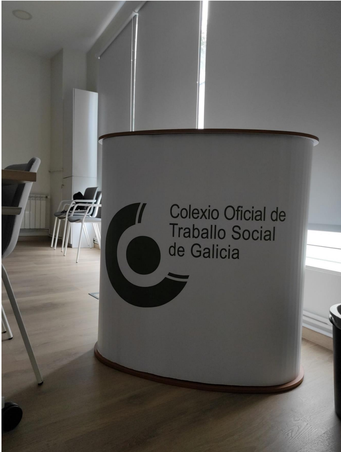
SOPORTE PARA MESA MOSTRADOR STAND PLEGABLE E TRANSPORTABLE