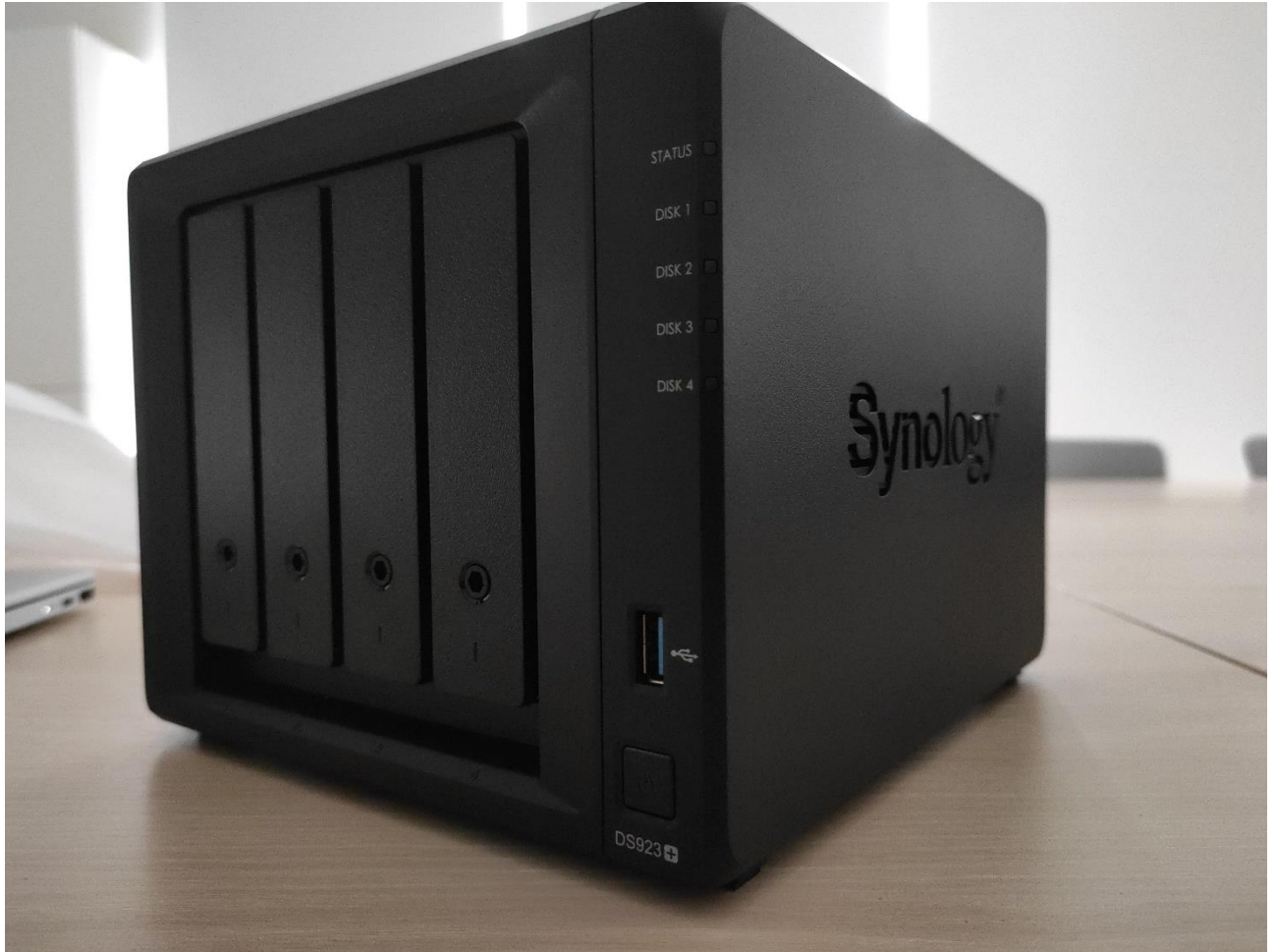
NAS SYNOLOGY MODELO DS923+