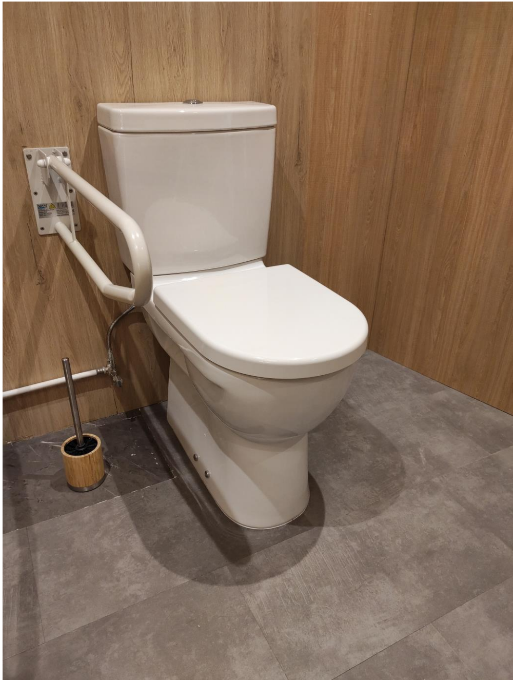
REUBICACIÓN E SUBSTITUCIÓN INODORO ADAPTADO