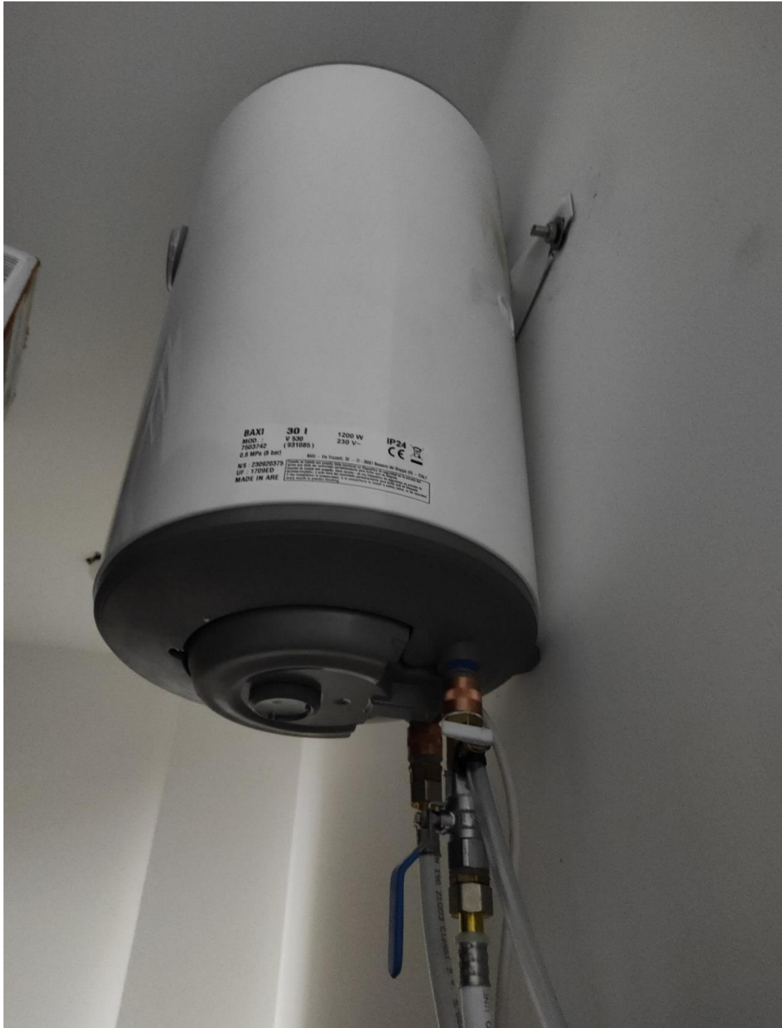
TERMO ELÉCTRICO BAXI MODELO V530 30 LITROS