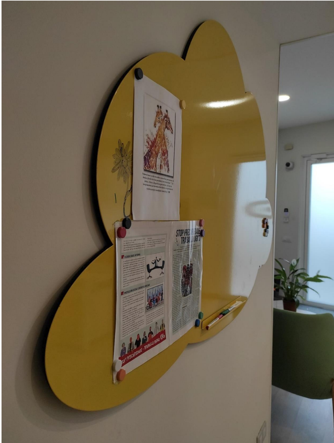
TABOLEIRO MAGNÉTICO MODELO NUBE 100x150 RECEPCIÓN