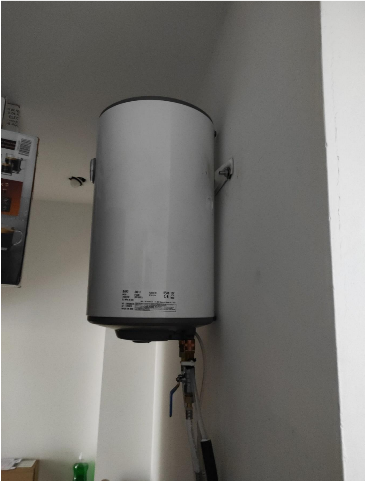
TERMO ELÉCTRICO BAXI MODELO V530 30 LITROS