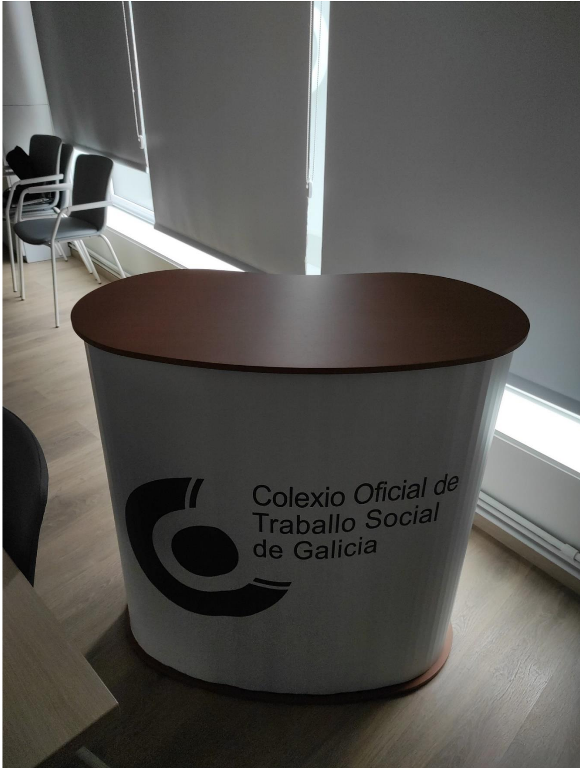
SOPORTE PARA MESA MOSTRADOR STAND PLEGABLE E TRANSPORTABLE