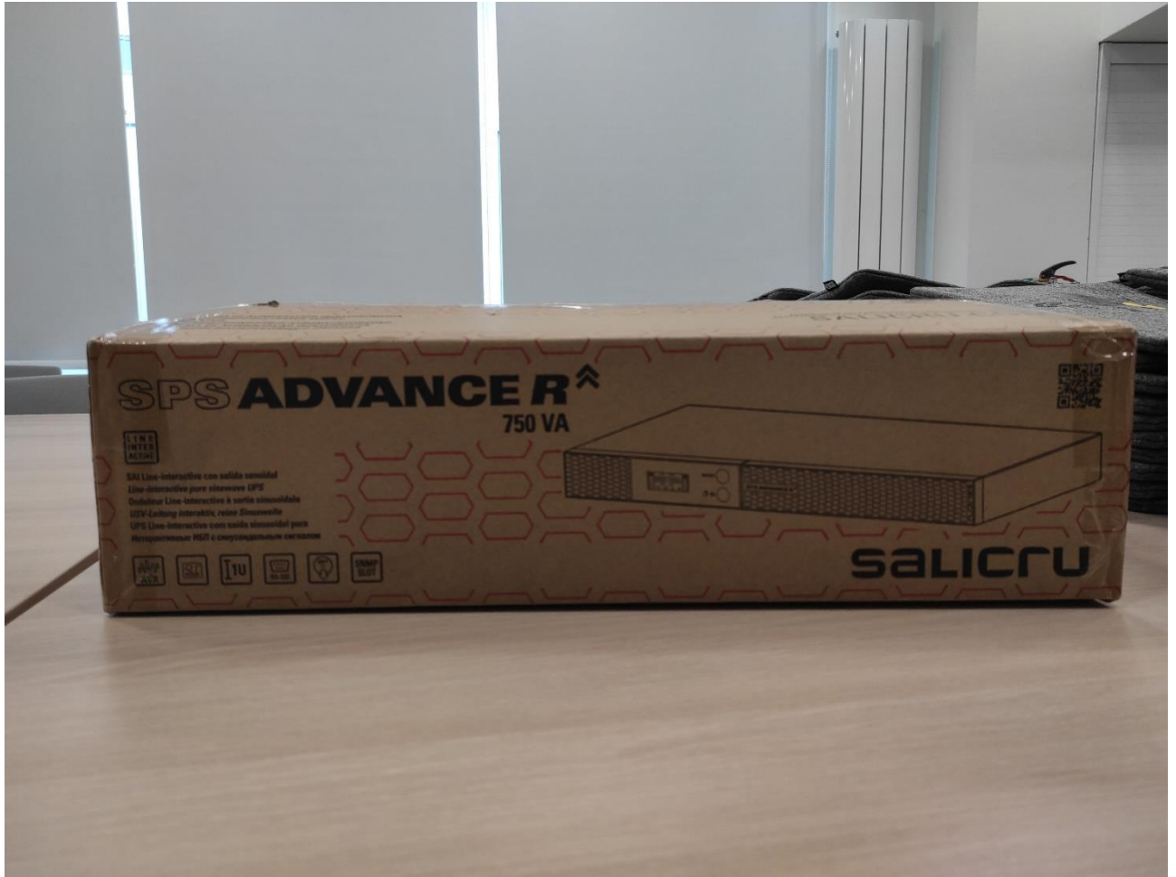
SAI SPS ADVANCE R 750 VA RACK