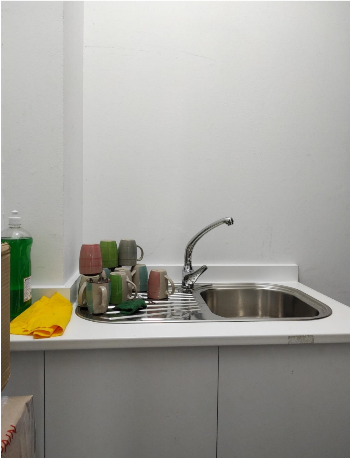
MOBLE VERTEDOIRO MARCA TEKA ( CUBETA + ESCURRIDOR ) E ENCIMEIRA