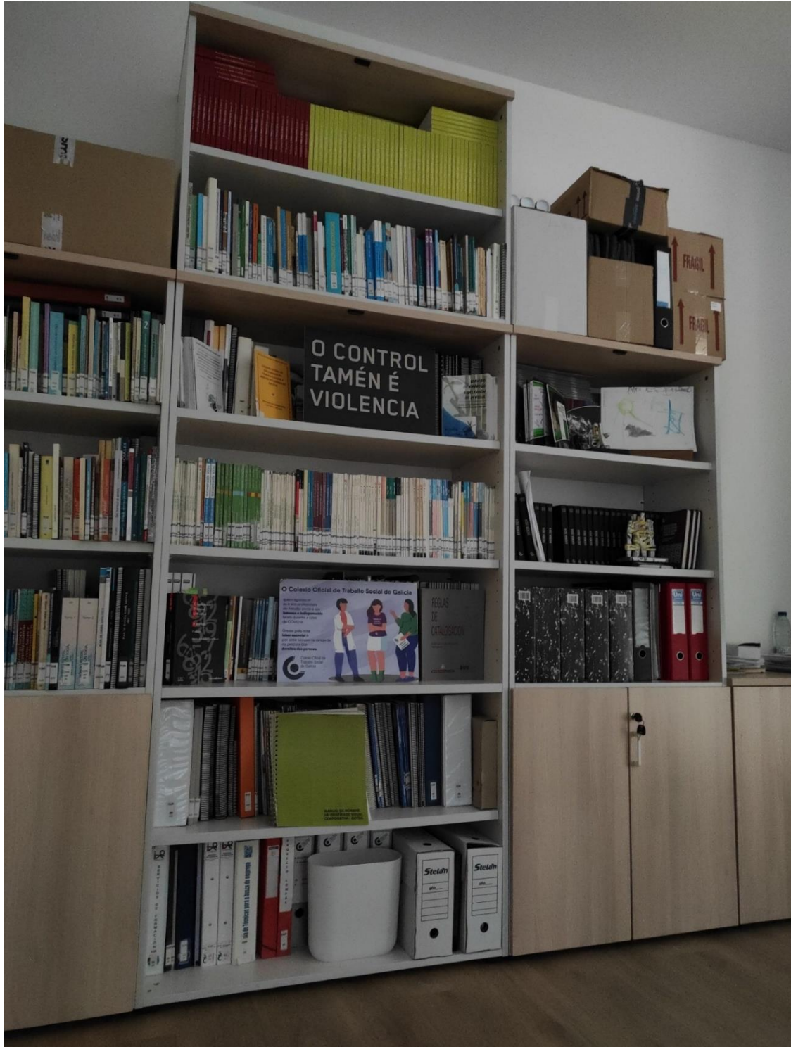
ESTANTERIA 100 CM ( MÓD. CENTRAL NA FOTO ) DESPACHO COORDINACIÓN