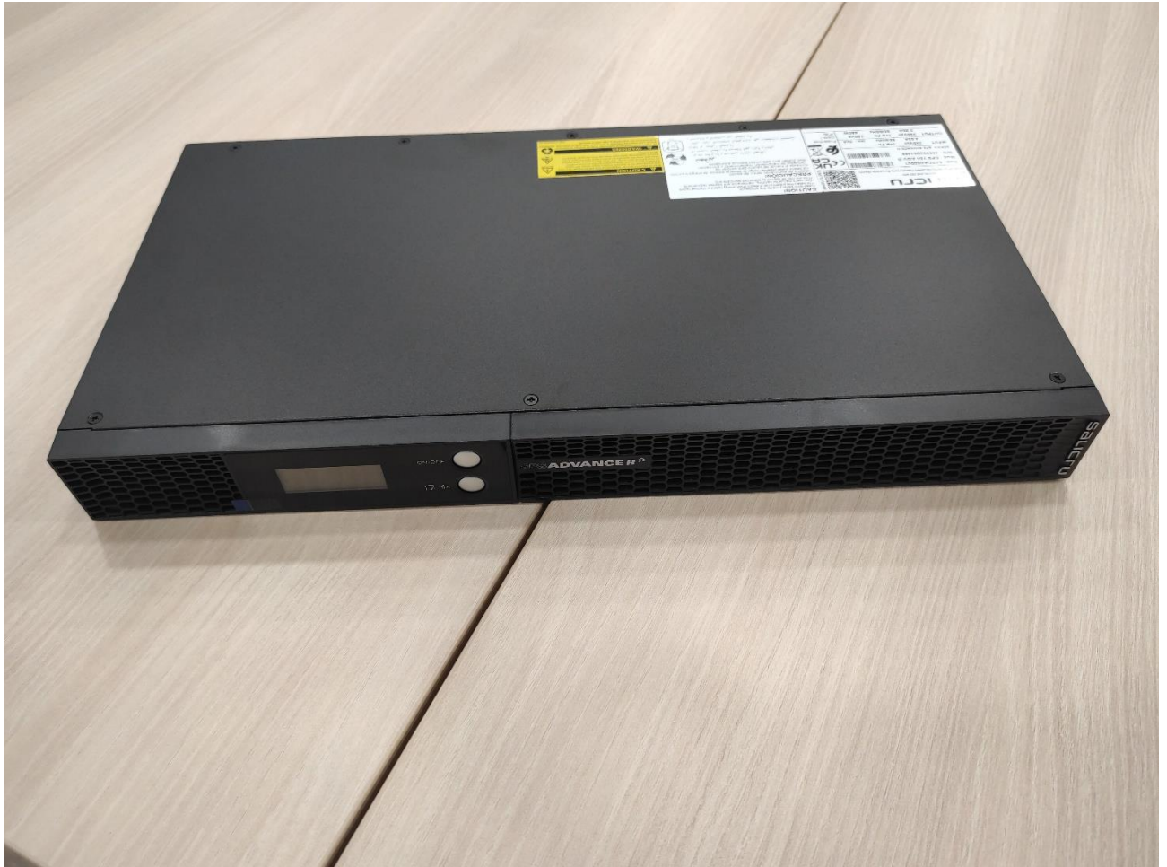
SAI SPS ADVANCE R 750 VA RACK