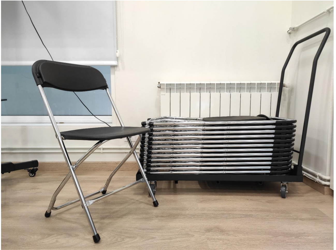
CADEIRA APILABLE MODELO LARA E CARRO ALMACENAXE