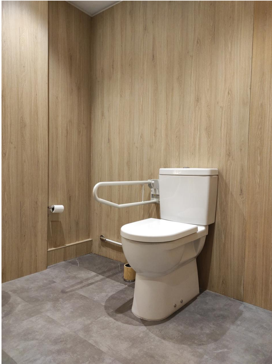
REUBICACIÓN E SUBSTITUCIÓN INODORO ADAPTADO