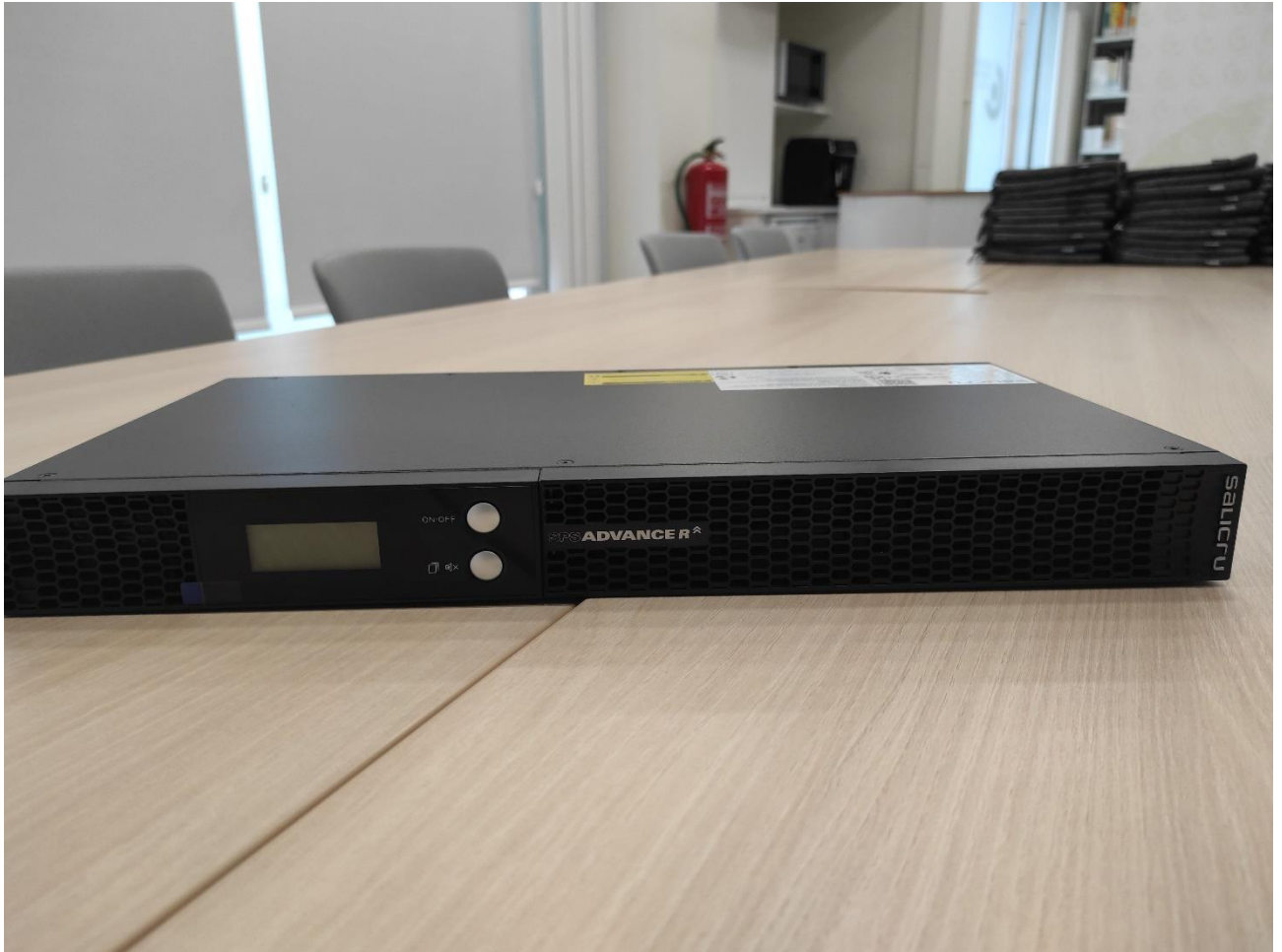
SAI SPS ADVANCE R 750 VA RACK