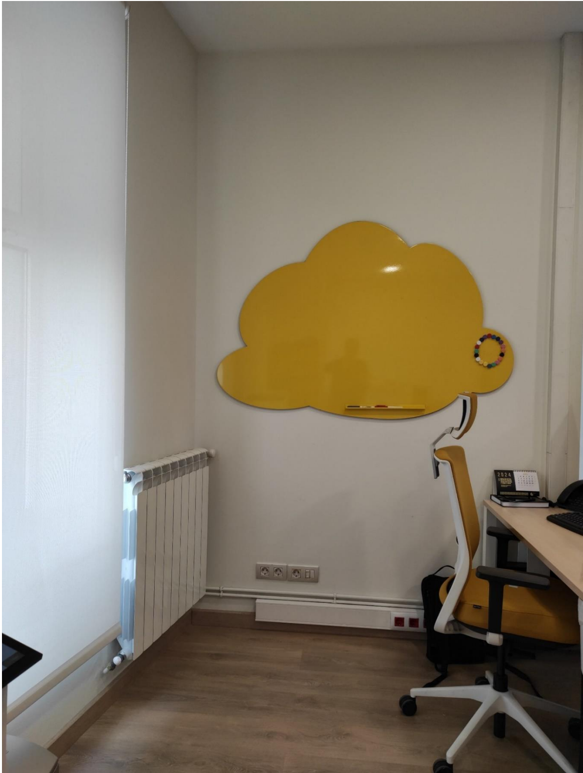
TABOLEIRO MAGNÉTICO MODELO NUBE 100x150 ADMINISTRACION