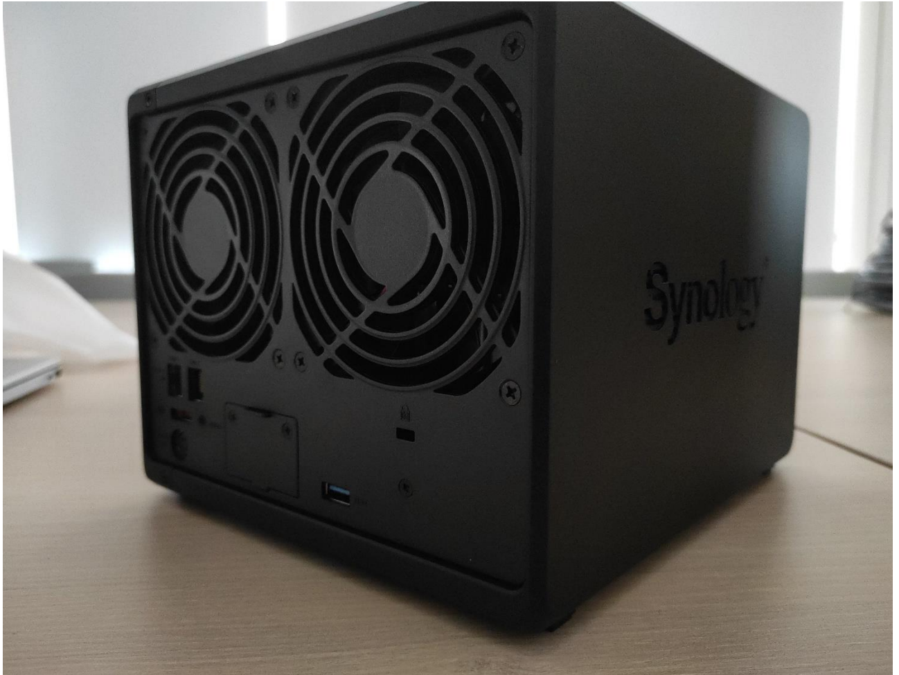
NAS SYNOLOGY MODELO DS923+