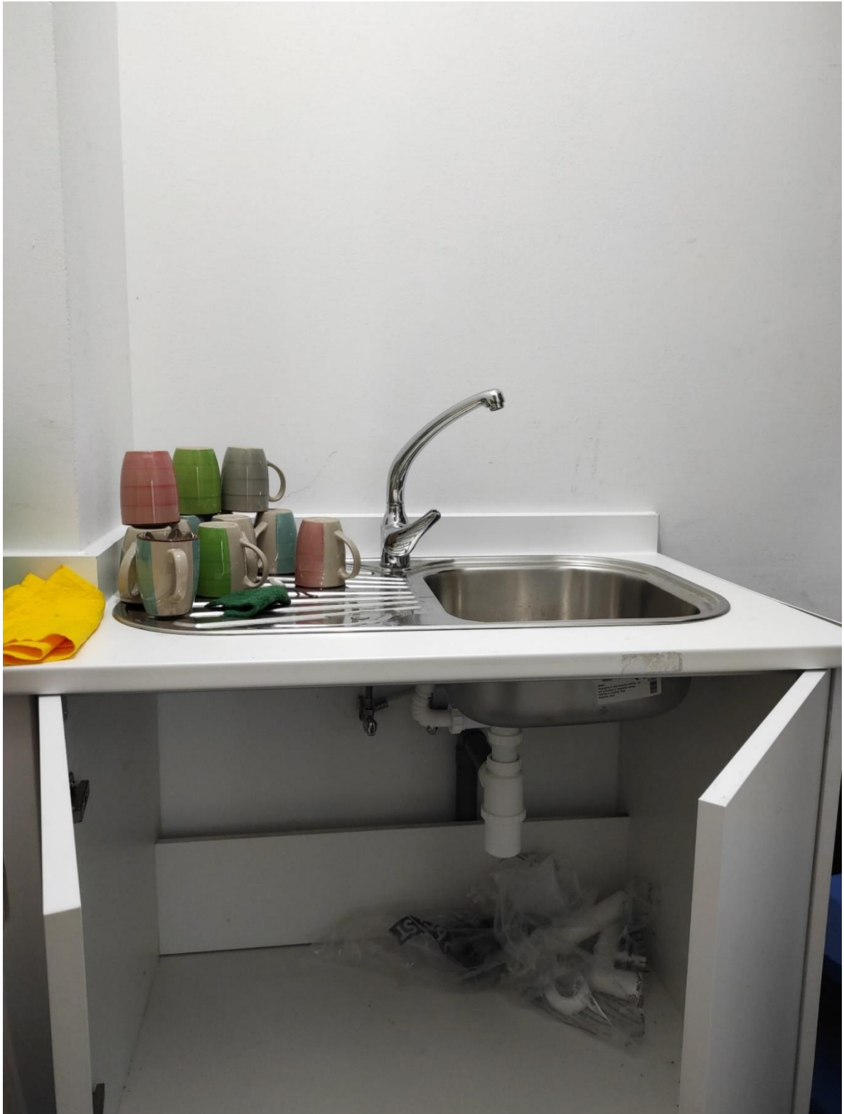
MOBLE VERTEDOIRO MARCA TEKA ( CUBETA + ESCURRIDOR ) E ENCIMEIRA