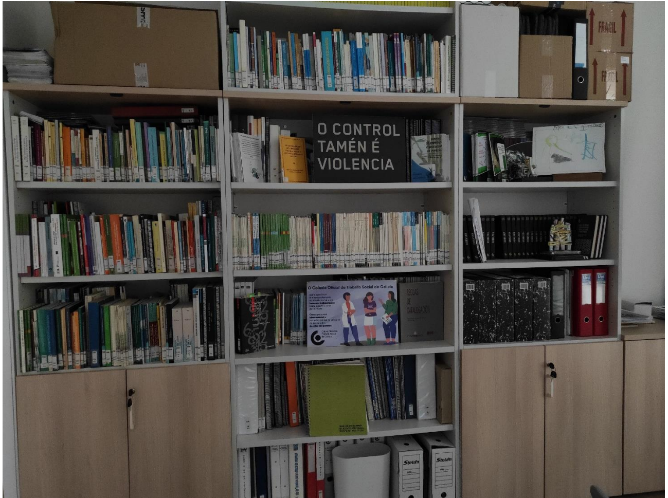
ESTANTERIA 100 CM ( MÓD. CENTRAL NA FOTO ) DESPACHO COORDINACIÓN