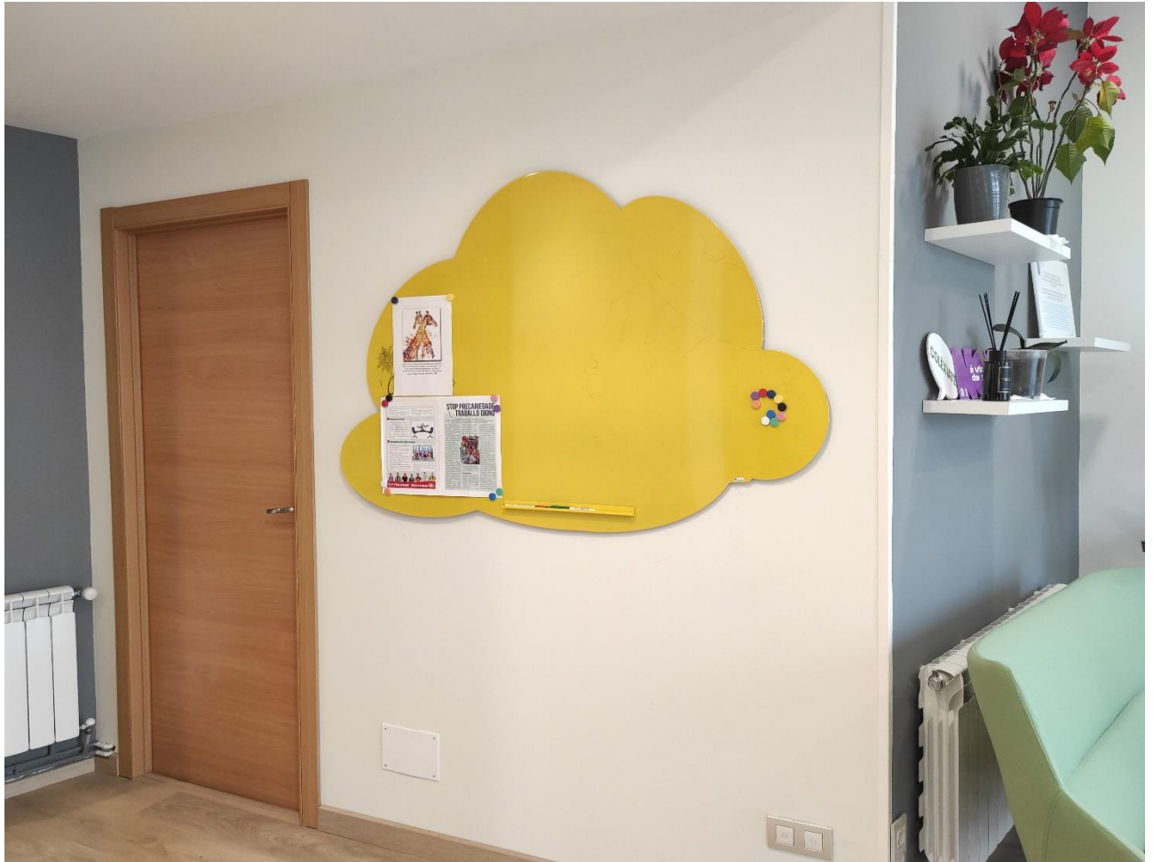
TABOLEIRO MAGNÉTICO MODELO NUBE 100x150 RECEPCIÓN